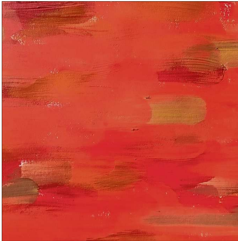
Die Impulsivität des Kämpfers an der Wand.